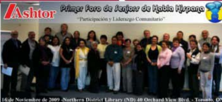
16 de Noviembre de 2009 -Northern District Library (ND) 40 Orchard View Blvd. - Toronto, ON

Se realizó el pasado lunes 16 de Noviembre el "Primer Foro de Seniors de Habla Hispana" de Toronto. Los participantes fueron recibidos por integrantes del "Board Of Directors" de ASHTOR, quienes